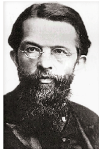
门格尔 ( 奥 , 1840-1921 ) : 《国民经济学原理》