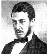
杰文斯 ( 英, 1835-1882 ) : 《政治经济学理论》